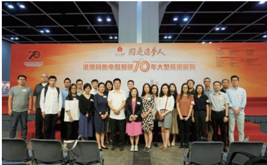
參觀建國70周年展覽