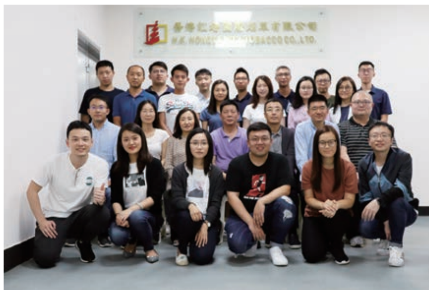
參觀香港紅塔國際煙草有限公司