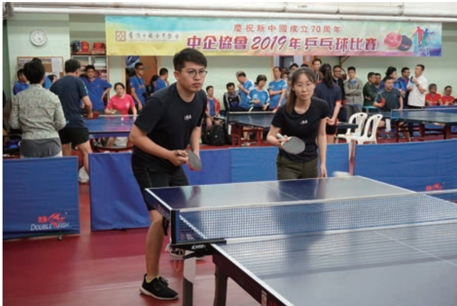
員工參加中企協會乒乓球比賽

此外，本公司非常關注員工的身心健康，為員工每年度安排身體檢查，採用大型體檢機構，為我們的員工進行全面體檢服務，確保本公司員工的健康。我們鼓勵員工多做運動，保持體魄健康。於本年度，我們安排員工參與羽毛球比賽和中企協會乒乓球團體友誼賽，讓員工多作有益身心的活動，我司隊員本着「友誼第一、比賽第二」的精神，努力拼搏，穩中求進，亦促進彼此同事之間的關係。