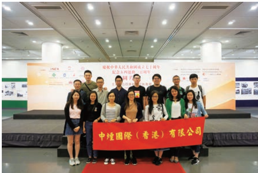
參觀紀念五四運動100周年展覽