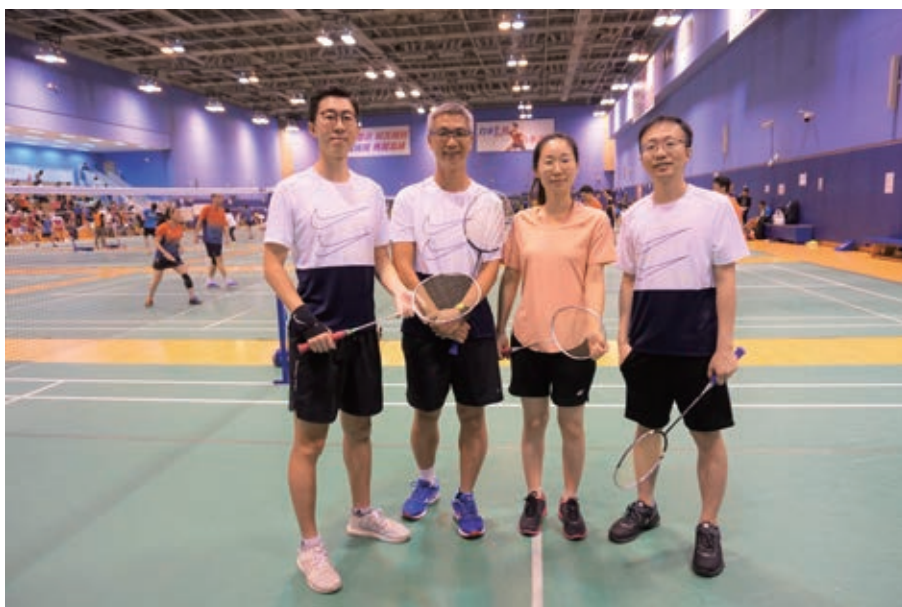
員工參與羽毛球比賽